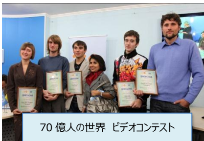
70 億人の世界 ビデオコンテスト 入賞者の皆さん

入賞者はお若い方が多く、より多くの若い人たちが、こうしたイベントに興味を持ち、参加してくれることはとても喜ばしいことだと感じました。日本でも、70 億人のアクションキャンペーンが展開されておりますが、この世界を構成する一人ひとりが、この世界のことを考え、行動にうつすことが、よりよい世界を作っていくのだと思います。