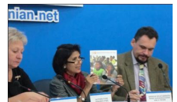
世界人口白書 2011 の発表

去る 2011 年 10 月 31 日は、世界人口が 70 億人に達するという、記念すべきイベントがありました。UNFPA ウクライナでも、70 億人の世界イベントの一環としてビデオコンテストが行われ、「世界人口白書 2011」の記者発表と共に、ビデオコンテスト上位入賞者の授賞式が行われました。