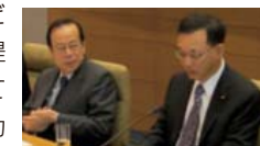
左: 福田JPFP名誉会長 右: 谷垣JPFP会長

国連人口基金東京事務所は、外務省、国際協力機構(JICA)などの政府関係諸機関やパートナーNGO(ジョイセフ等)と連携をとり、リプロダクティブ・ヘルス/家族計画などの世界の人口問題に関する最新情報を提供するとともに、国連人口基金が行っている活動について、さらなる理解と協力をいただけるよう、広報活動や政策提言(アドボカシー)に努めています。